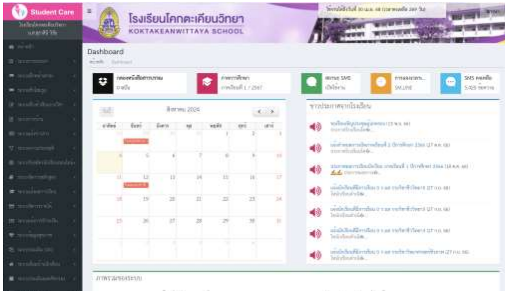
ภาพที่ 5 ระบบ Student Care ระบบดูแลช่วยเหลือนักเรียน และบริหารสถานศึกษา เข้าถึงได้ที่ https://www.student.co.th