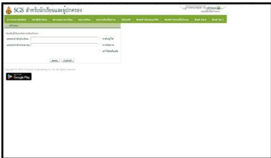
ภาพที่ 2 ระบบการวัดและประเมินผลการศึกษาสำหรับผู้ปกครองและนักเรียน เข้าถึงได้ที่ https://sgs6.bopp-obec.info/sgss/security/signin.aspx