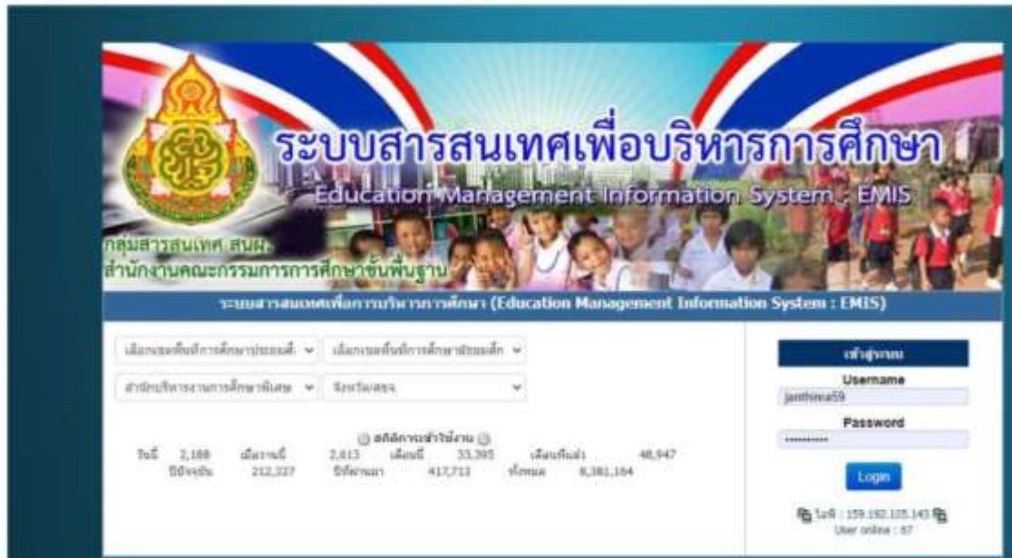
ภาพที่ 1 ระบบสารสนเทศเพื่อบริหารการศึกษา