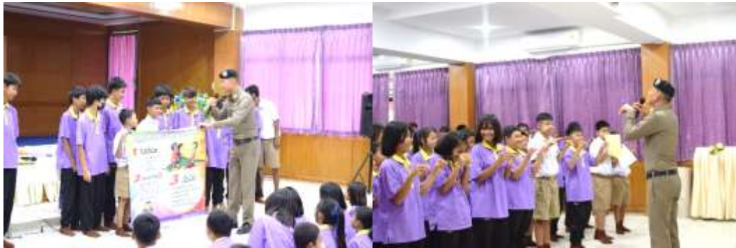
รูปภาพการอบรมด้านภัยยาเสพติดภายในโรงเรียน