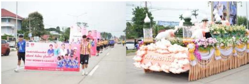
รูปภาพกิจกรรมเวียนเทียนในวันสำคัญกิจกรรมแห่เทียนเข้าพรรษา