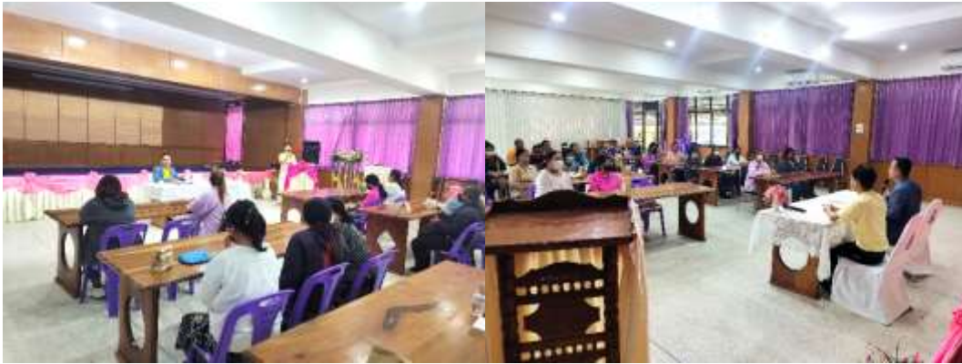
รูปภาพประชุมผู้ปกครองนักเรียน