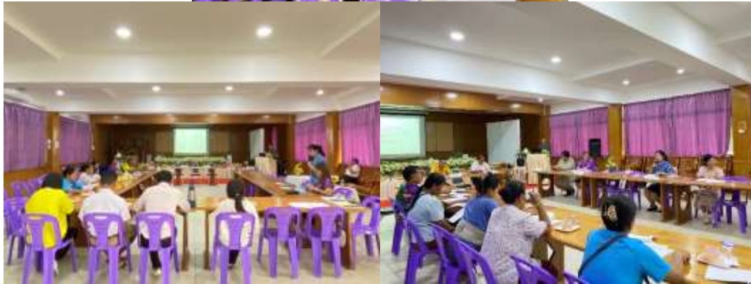
รูปภาพการประชุมของคณะกรรมการสถานศึกษาขั้นพื้นฐานในวาระต่าง ๆ